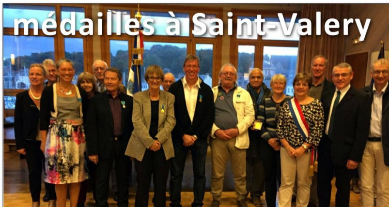
Mme Dominique CHAUVEL, députée et maire de Saint-Valery-en-Caux, s'est fait une grande joie d'accueillir dans sa mairie des bénévoles valeriquais exemplaires.

Il continua son propos en valorisant les actions désintéressées : « On sait que le bénévolat est attentif aux besoins dans la société et stimule la participation de la collectivité pour y